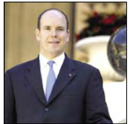
Riba foto di archivo, Prins Alberto II, di Monaco.

Principe reinante for di morto di su tata, Rainiero III dia 6 di april, Alberto II, di 47 aña di edad a expresa su gran